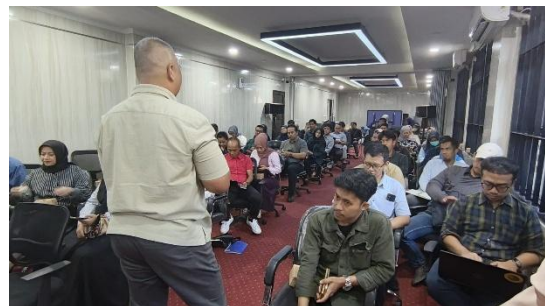
Gambar 4. Bimbingan Teknis Pembuatan Video Inovasi