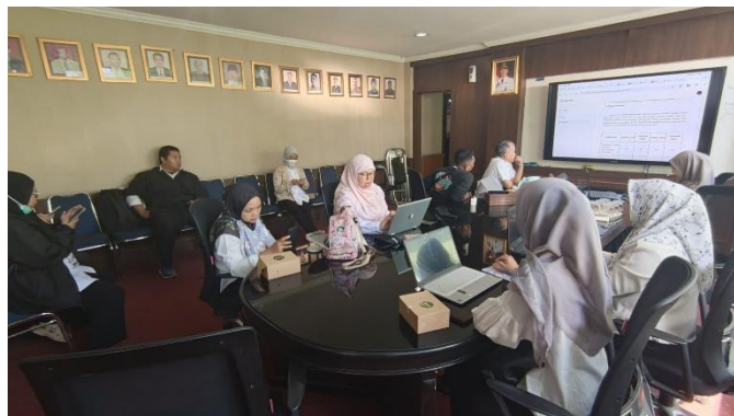
Gambar 7. Desk Pengisian Bukti Dukung KIPP