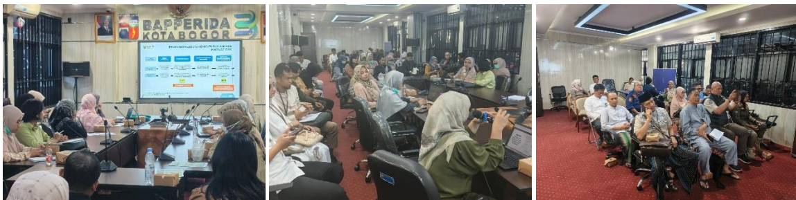
Gambar 2. Rapat Persiapan Kompetisi Inovasi Pelayanan Publik (KIPP) Tahun 2025