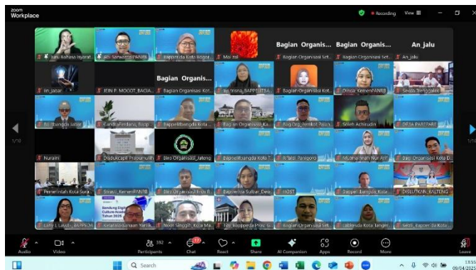
Gambar 1. Sosialisasi Kebijakan KIPP melalui Zoom