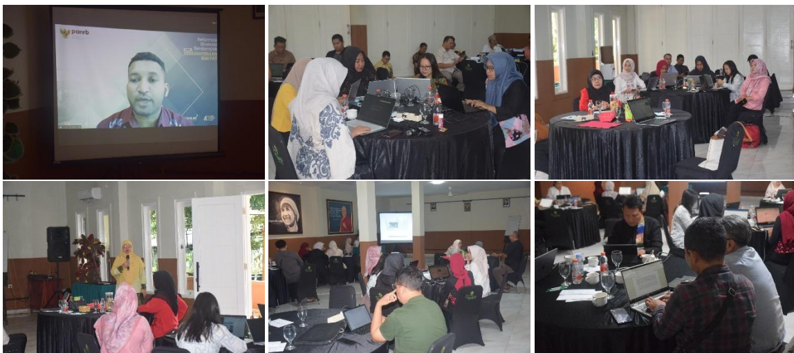
Gambar 5. Coaching Clinic KIPP 2025