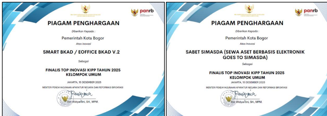
Gambar 8. Piagam Penghargaan KIPP 2025