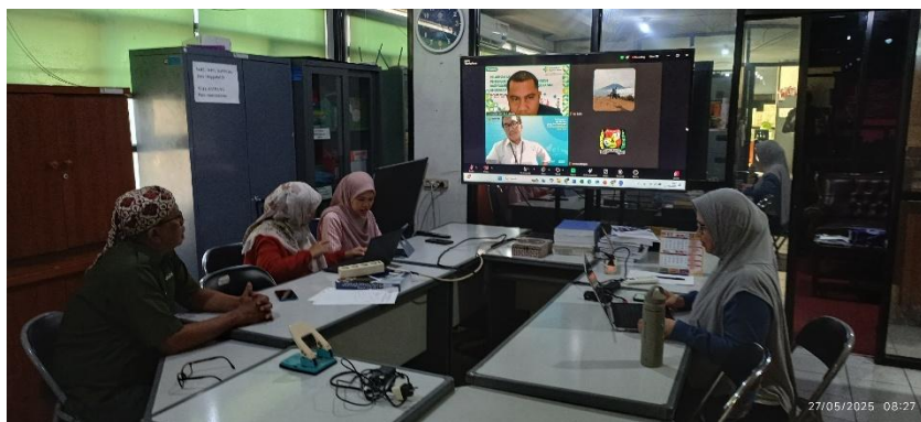
Gambar 3. KIPPedia melalui Zoom